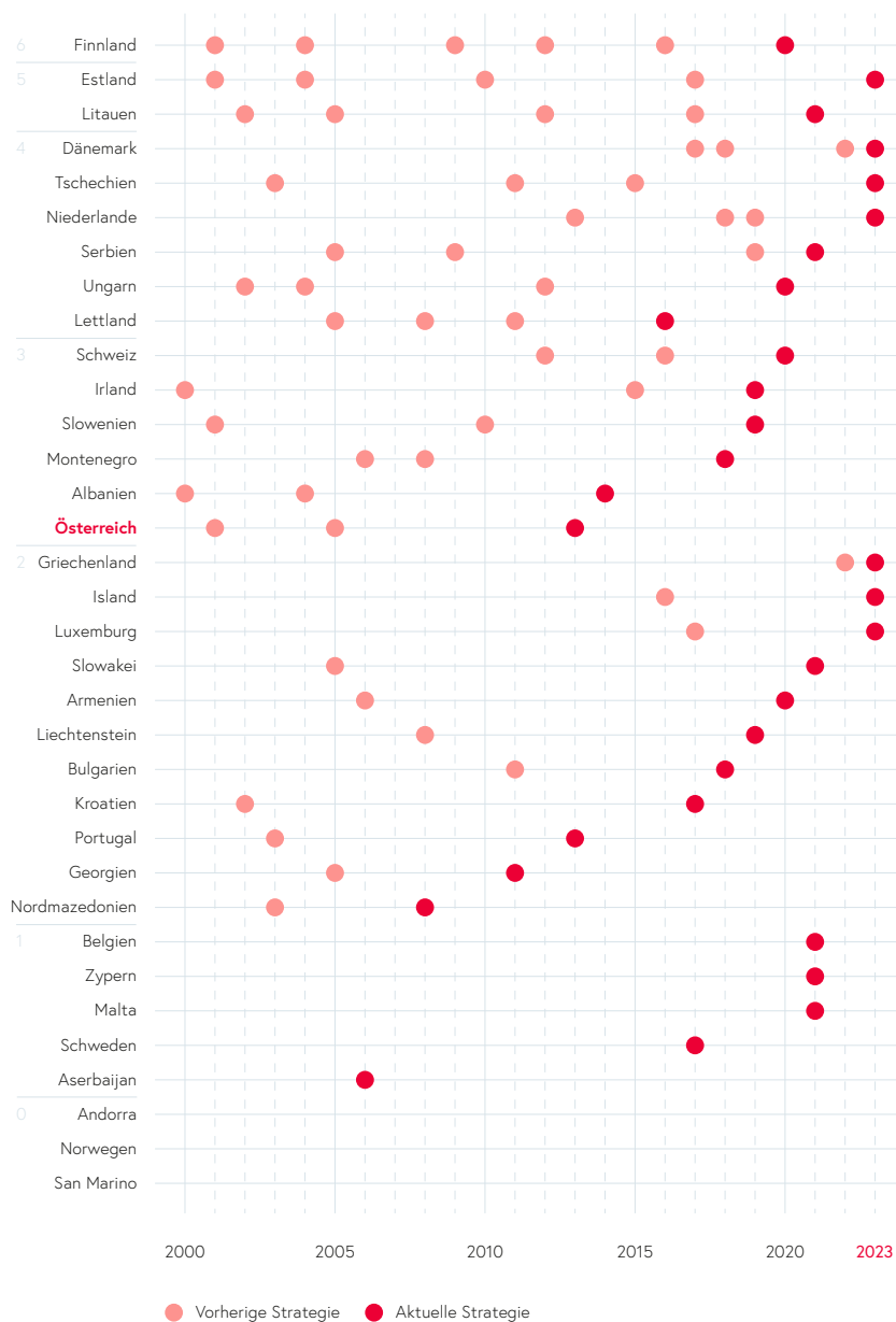
Abbildung 1: Grand Strategien europäischer Kleinstaaten seit dem Jahr 2000. Die Reihung der Staaten erfolgte nach der Anzahl der Grand Strategien und dem Jahr der zuletzt veröffentlichten Strategie (dunkelrot).

Im Fall der Niederlande wurden Sicherheitsstrategien aus den Jahren 2007 und 2010 nicht inkludiert, da diese überwiegend einen innerstaatlichen Bezug aufwiesen.